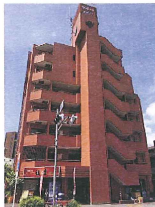
外観 令和元年6月撮影

(徒歩3分) キヤンドウ(新馬場店) ..... 徒歩2分 マルエツプチ(品川橋店) ... 徒歩3分