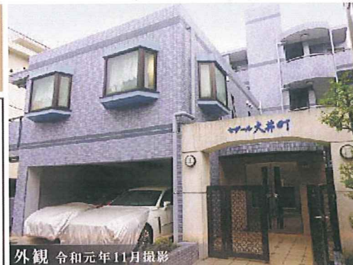
外観 令和元年11月撮影

新規内装リノベーション中 令和2年1月21日完了予定 ※内装中でも、ご内覧いただけます