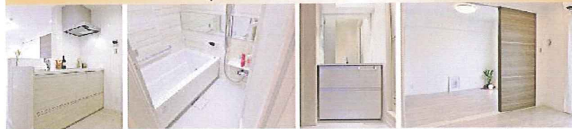
建具:ヨーロッパウォールナット柄 / 床:オーク柄(パールグレー)

Natural style 淡い色のフローリングにベージュと白を基調とした 設備を導入し、どんなライフスタイルにも合う仕様。