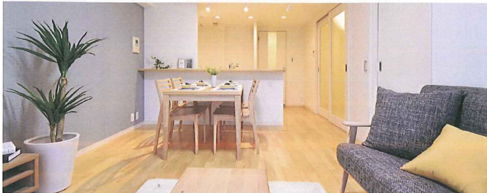
リビング・ダイニング・キッチン(約14.3畳)

総戸数193戸のビッグコミュニティ・管理体制良好です！ 商業施設も充実の品川シーサイド♪