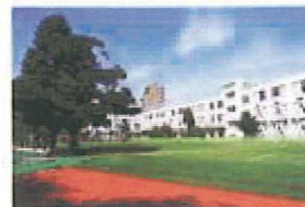
区立大井第一小学校