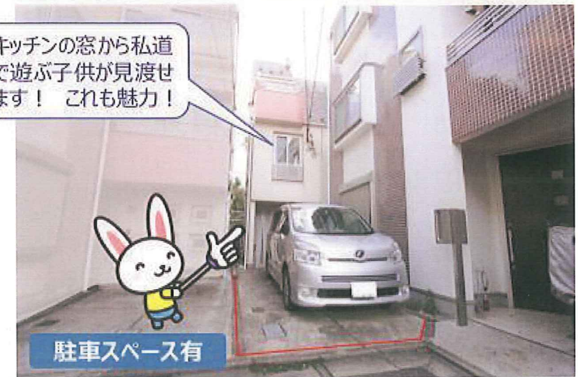
キッチンの窓から私道 で遊ぶ子供が見渡せ ます！ これも魅力！