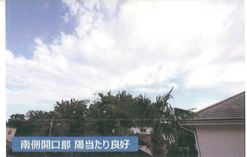
南側開口部 陽当たり良好