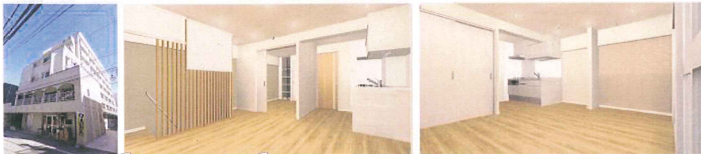
※室内画像は完成予定ベースです