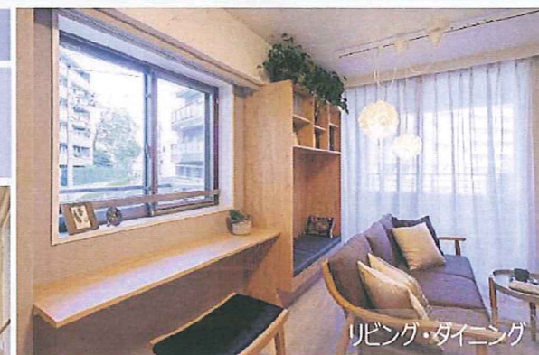
リビング・ダイニング