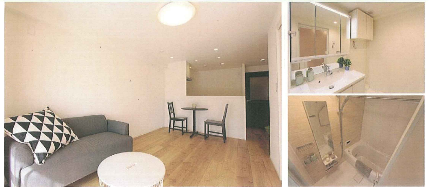
※写真はすべて完成イメージです。