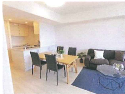
リビングダイニング(左上) キッチン(左下) 外観(右下) 2019年8月撮影