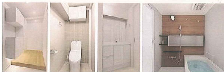
※室内画像は完成予定パースです。