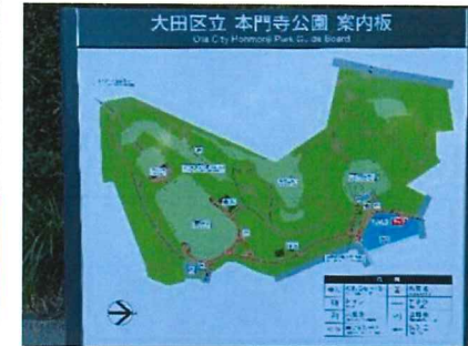
本門寺公園(徒歩2分)