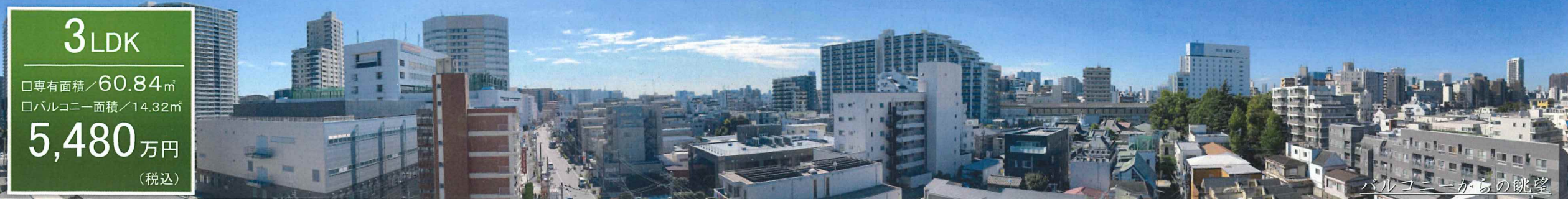
バルコニーからの眺望

Access 京急本線「青物横丁」駅まで徒歩6分 りんかい線「品川シーサイド」駅まで徒歩8分