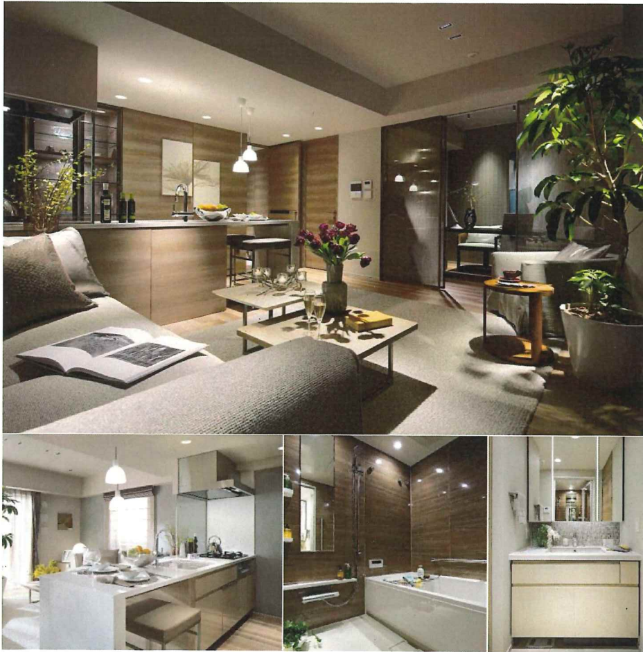
※上記写真はイメージとなります。