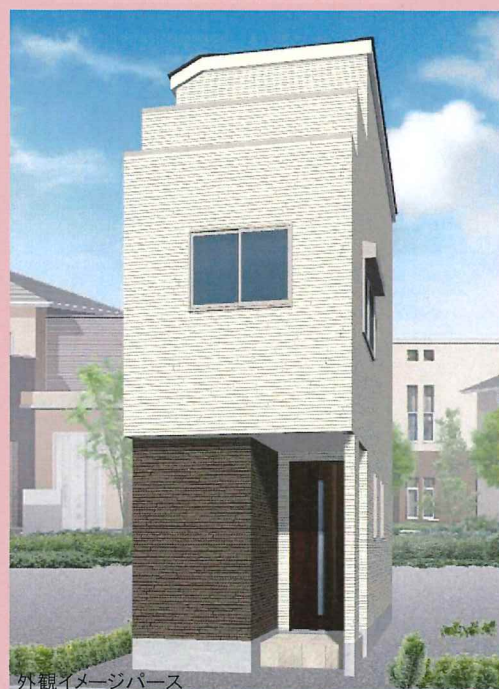
外観イメージパース