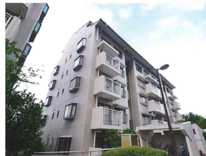
※図面と現況が異なる場合は現況を優先いたします。