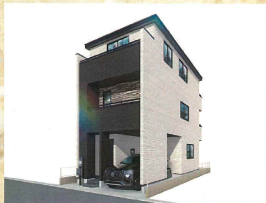
※イメージパース 実際のものとは多少異なります