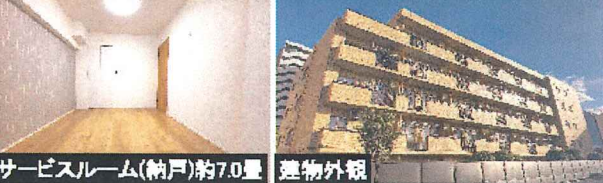
サービスルーム(納戸)約7.0畳