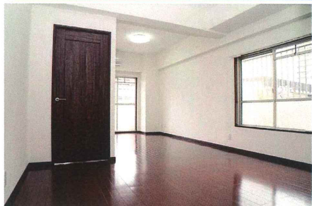
▲2面採光で明るいリビングダイニング