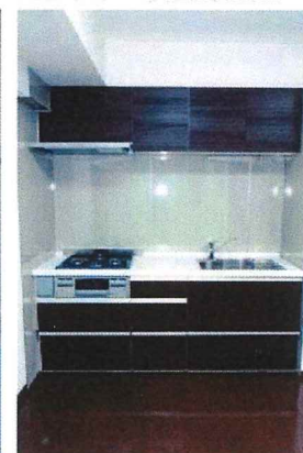
▲ガス三口コンロ付の本格システムキッチン