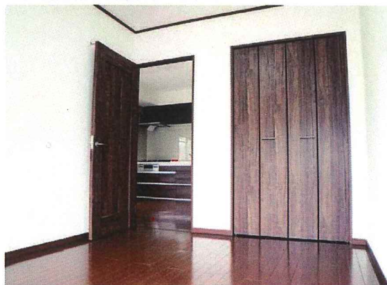
▲洋室①にはクローゼットも完備