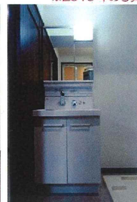
▲シャワー水栓付洗面台