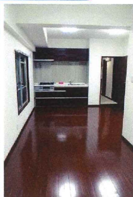
▲バルコニー側から