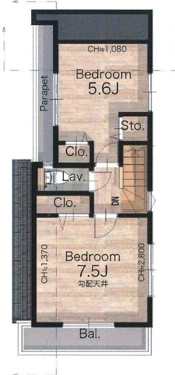
3F 29.65㎡ Total 106.46㎡