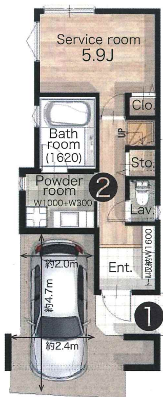
1F 38.93㎡ (車庫面積9.95㎡含む)

住居表示：品川区大井4丁目25-30(旧) 土地面積：62.21㎡ 引渡時期：2024年8月下旬予定 現況：完成 建ぺい率/容積率：60%/200% 土地権利：所有権 用途地域：第一種中高層住居専用地域 高度地区：第二種高度地区 防火指定：準防火地域 建築確認番号：SJK-KX236010680 学区：区立大井第一小学校、区立伊藤学園 ※図面と現況が異なる場合は、現況が優先となります。