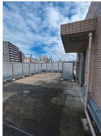
ルーフバルコニー