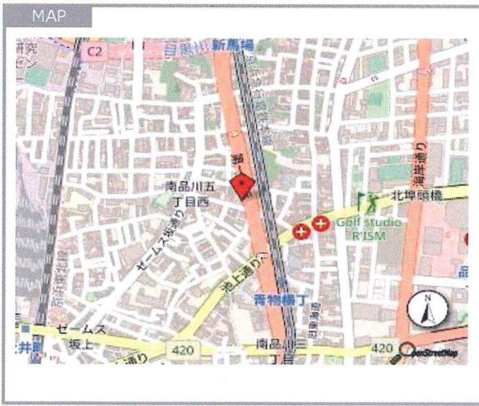
図面と現況が異なる場合は、現況優先といたします。

設備 ネット無料、BS、CS110度、オートロック、防犯カメラ、集合郵便受け、宅配用ボックス、管理人、敷地内駐車場有、バイク置場、免震構造、エレベーター2基、CATV、モニター付インターホン、角部屋、ペット不可、給湯（ガス）、システムキッチン、グリル、コンロ口数3、バス・トイレ別、洗面所独立、追い焚き風呂、温水洗浄暖房便座、室内洗濯機置場、浴室乾燥機、エアコン、フローリング、バルコニー