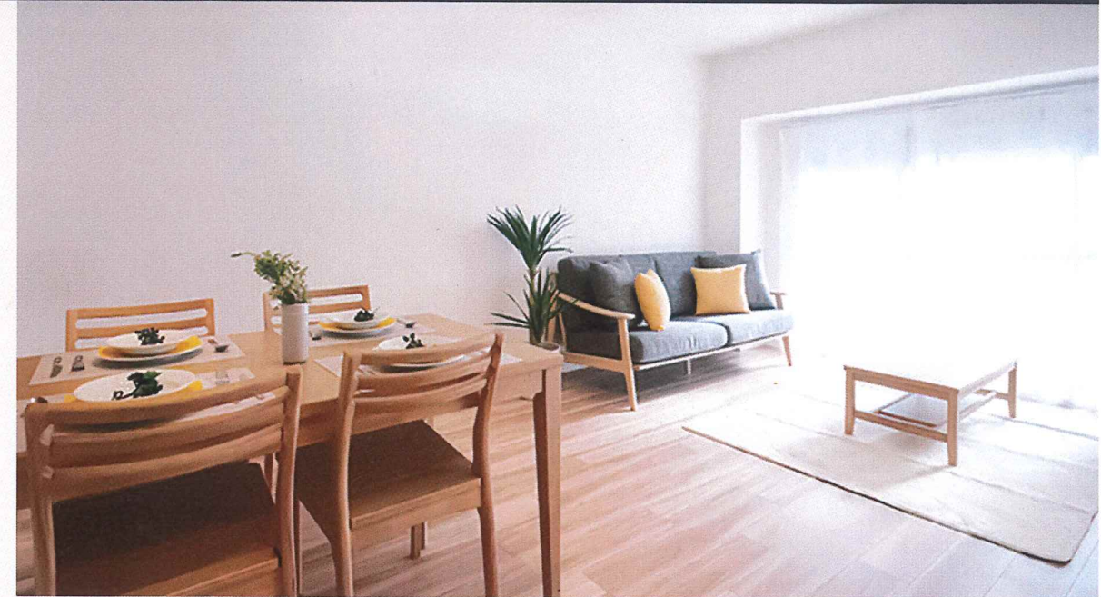
【イメージ写真】写真は一例ですので実際のものとは異なる場合があります。